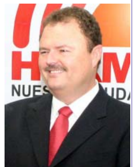
Ernesto Gándara Camou