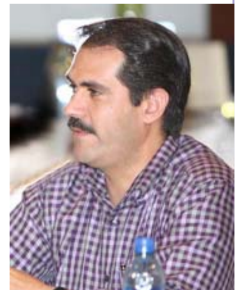
Guillermo Padrés Elías